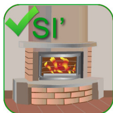
CAMINI CHIUSI E INSERTI