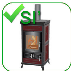
STUFE E CALDAIE